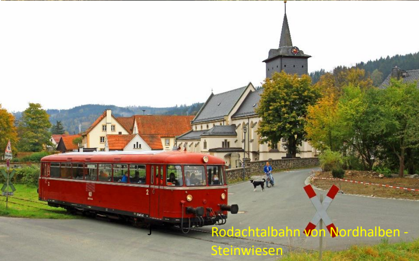
Rodachtalbahn von Nordhalben - Steinwiesen