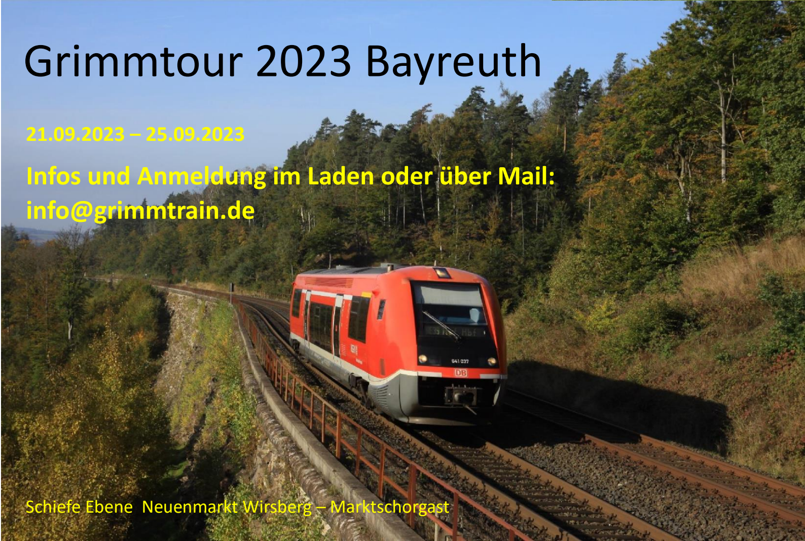
Schiefe Ebene Neuenmarkt Wirsberg – Marktschorgast

Infos und Anmeldung im Laden oder über Mail: info@grimmtrain.de