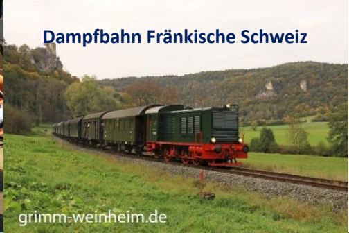
Dampfbahn Fränkische Schweiz

DEUTSCHES DAMPFLOKOMOTIV-MUSEUM IM EHEMALIGEN BAHNBETRIEBSWERK NEUMARKT WIRSBERG