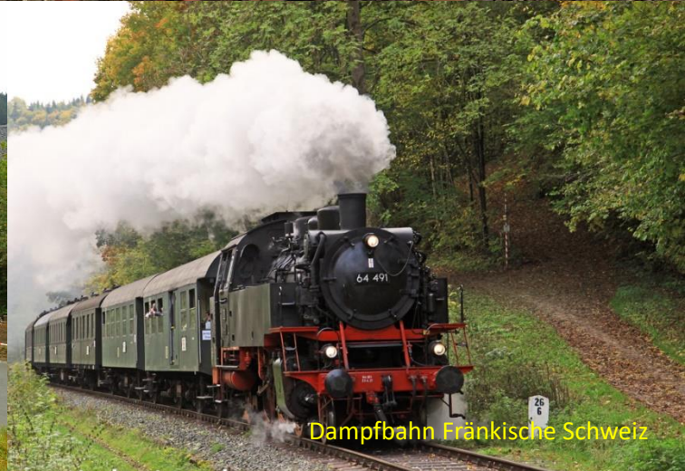
Dampfbahn Fränkische Schweiz